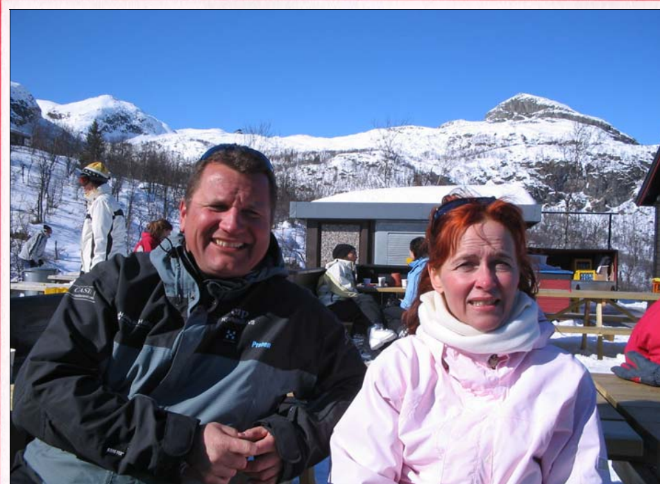
Hygge i Hemsedal